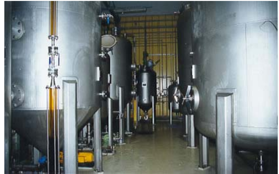
Cuves d'estérification ( Eco Energie Etoy )

Le biodiesel est également commercialisé, principalement à travers la firme FLAMOL qui gère plusieurs stations-service dans le canton de Berne et qui revend le produit à l'état pur. Plusieurs entreprises de transport utilisent notamment un mélange contenant 30% de biodiesel appelé « Combi-Diesel ».